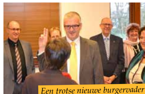
Een trotse nieuwe burgervader legde op 18 december de eed af.

Eric werd geboren in Lier op 9 maart 1965. Het grootste deel van zijn jeugd